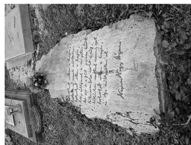
Sírkő a Farkasréti temetőben